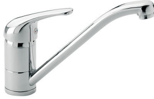
Mitigeur S1000 - RO 8443 002